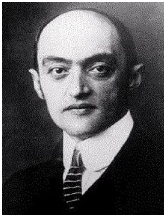
Joseph Schumpeter 1883-1950

L'entreprise et l'entrepreneur sont les clés du développement